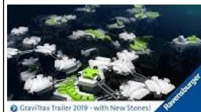
GraviTrax Trailer 2019 - with New Stones!